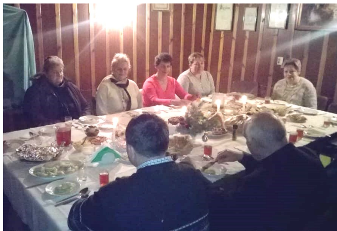
Uczestnicy świątecznego spotkania w Sąsiadce