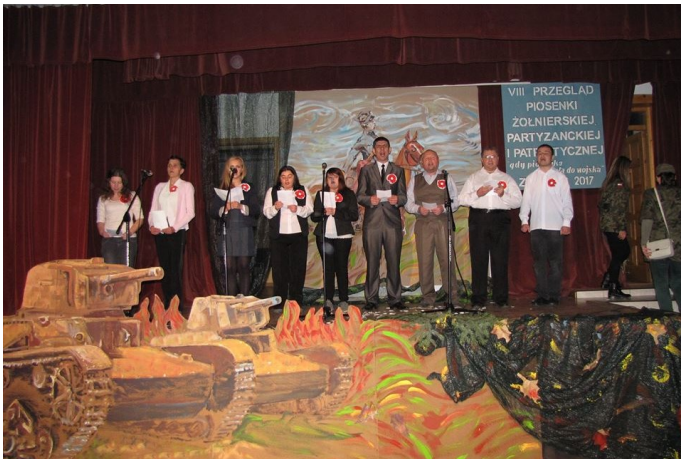
Występ podczas VIII Przeglądu Piosenki Żołnierskiej w Zamościu

19.12.2017 r. w Warsztacie Terapii Zajęciowej w Rozłopach odbyła się uroczysta wigilia. Wśród licznie zgromadzonych gości znalazły się władze Starostwa Powiatowego w Zamościu, Gminy Sułów, oraz Powiatowego Centrum Pomocy Rodzinie w Zamościu. Nie zabrakło również rodziców uczestników. W serdecznej atmosferze wszyscy dzielili się opłatkiem, spożywali wigilijne potrawy i słuchali kolęd w wykonaniu naszych uczestników.