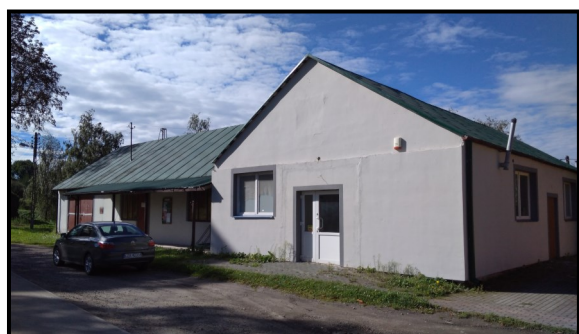
Gminne Centrum Kultury w Sułowie