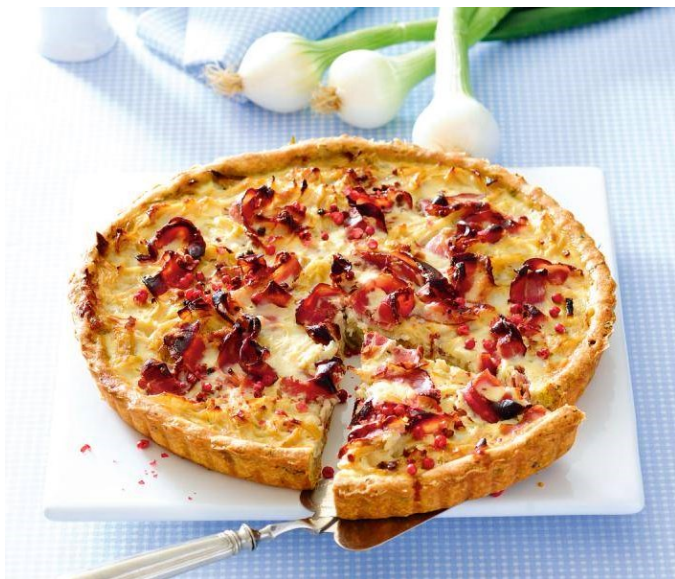
Tarta z boczkiem

Upieczone i ostudzone ciasto, przekroić na dwa blaty, nasączyć zimnym naparem mocnej słodkiej herbaty z sokiem z cytryny, a następnie blaty przełożyć kremem. W rondelku w odrobienie mleka rozpuścić 1,5 tabliczki czekolady i tak powstałą polewą oblać ciasto. Włożyć ciacho do lodówki. Można konsumować po kilku godzinach jak krem się dobrze zetnie, a najlepiej na drugi dzień.