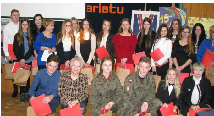
Najaktywniejsi wolontariusze zostali nagrodzeni

W Zamojskim Centrum Wolontariatu odbyła się 05.12.17 r. Gala Inicjatyw Społecznych łącząca w sobie Galę Wolontariatu i Galę konkursu na „Inicjatywę Roku”.