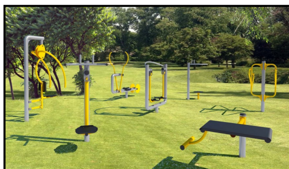
Budowa siłowni zewnętrznych