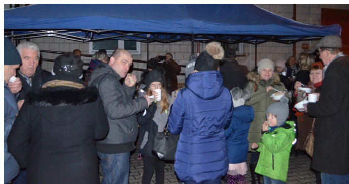
Ze spotkania nikt nie odszedł głodny