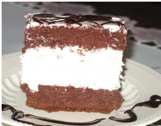
W-Z troszkę inaczej

Kapustę odcisnąć, wrzucić do solonej wody, dodać 2 liście laurowe i ziarna ziela angielskiego. Obrąć ziemniaki i marchew, pokroić w kostkę i dodać do zupy. Gotować ok. 30 min. Następnie przyprawić i dodać koncentrat pomidorowy. Boczek pokroić w kostkę, cebulę i czosnek również pokroić w kostkę. Na rozgrzanej patelni wrzucić boczek, podsmażyć, następnie dodać cebulę i czosnek, smażyć jeszcze 5-6 min. Boczek z cebulą i czosnkiem dodać do zupy, gotować ok. 20 min. Można posypać posiekanym koperkiem lub natką pietruszki.