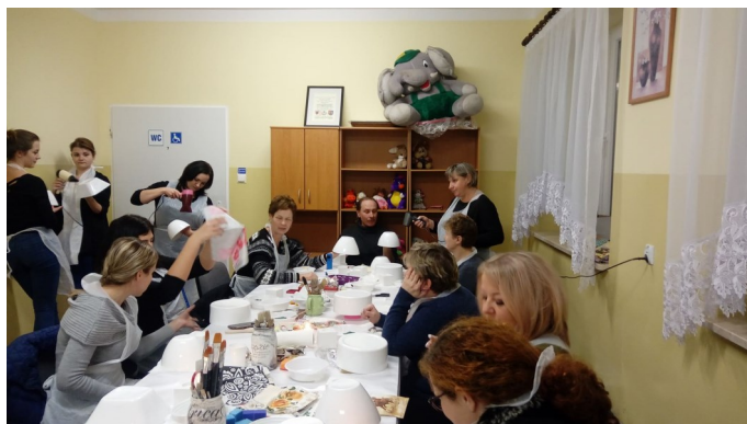
Frekwencja na spotkaniu dopisała