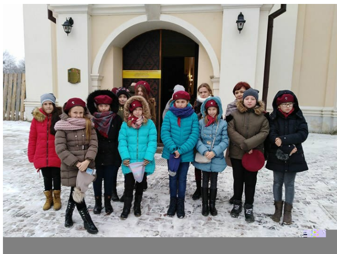
Drużyna harcerska „Złote Gryfy” z Michalowa

„SEKRETY WSI” - Gazeta Regionalna - Gminy Sułów