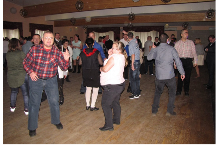
Zabawa Andrzejkowa w Marinie

20.11.2017 r. w restauracji "Marina" w Nieliszu odbyła się Zabawa Andrzejkowa. Oprócz gospodarzy - uczestników z Warsztatu Terapii Zajęciowej w Rozłopach, wzięli w niej też udział uczestnicy z Warsztatu Terapii Zajęciowej w Lipinie Starej, Dominikanówce, Zwierzyńcu oraz Grabowicy.