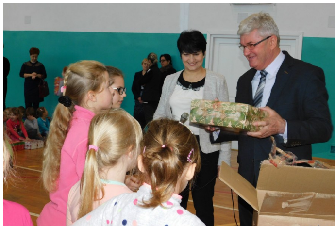
Mikołajkowe prezenty trafiły do dzieci

Dzięki współpracy Gminy Sułów z Chrześcijańskim Centrum Pomocy Dzieciom i Rodzinie, chłopcy i dziewczynki z naszej szkoły w wieku od 4 do 12 lat otrzymały mikołajkowe prezenty. Wszyscy obdarowani nie kryli swojego szczęścia i zadowolenia. To dla naszej szkoły wspomniały dzień.