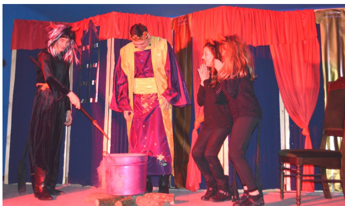
Dobro zwycięża—za swe uczynki Herod trafia do kotła

Występ został przyjęty gromkimi brawami. Następnie na scenie pojawili się goście z Warsztatów Terapii Zajęciowej z Rozłopów, którzy specjalnie na tę okazję przygotowali krótki koncert kolęd. Dobrze wszystkim znana melodia ulubionych świątecznych kolęd porwała zgromadzonych na widowni do wspólnego śpiewu. Po wspólnym kolędowaniu, pod chłodnym grudniowym niebem czekał na uczestników Spotkania poczęstunek w postaci gorącego czerwonego barszczu i tradycyjnej świątecznej kapusty przygotowanych przez pracownice GOPS. Nastrój wspólnego świętowania towarzyszył tego wieczoru wszystkim obecnym, będąc najlepszym podsumowaniem odchodzącego 2017 roku.