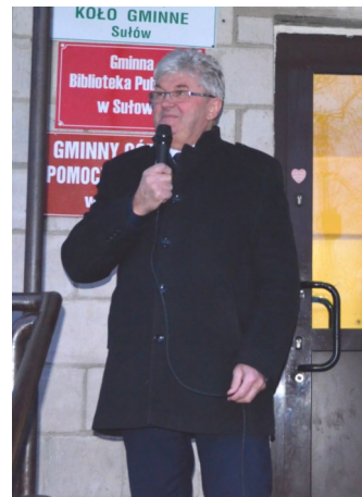
Życzenia mieszkańcom złożyły władze gminy