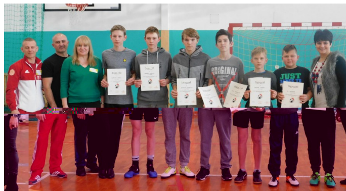
Turniej odbył się w ramach akcji PDPZ

Wszystkim uczestnikom turnieju oraz kibicom serdecznie dziękujemy.