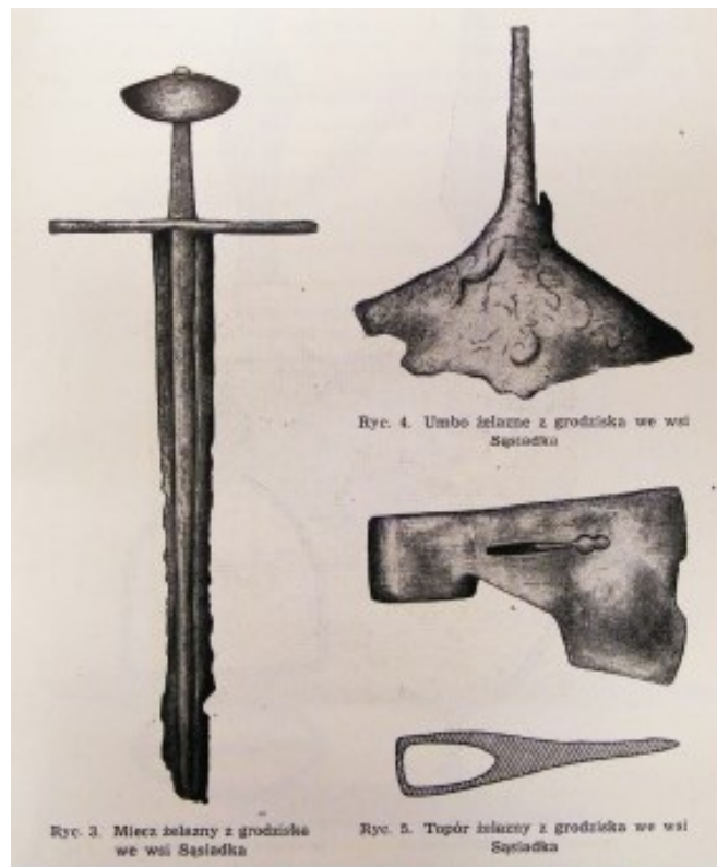
Ryc. 4. Umbo żelazne z grodziska we wsi Sasiadka